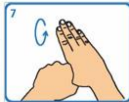
7 Fregar os polgares mediante un movemento rotatorio