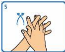
5 Fregar palma sobre palma cos dedos entrelazados