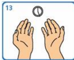
13 Este proceso debe levar entre 40 e 60 seg

Adaptado de NHS e World Health Organization Guidelines on Hand Hygiene in Health Care