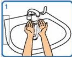
Humedecer as mans