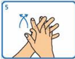
Fregar palma sobre palma cos dedos entrelazados