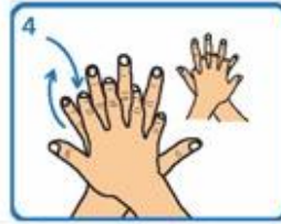
Fregar palma sobre dorso cos dedos entrelazados e viceversa