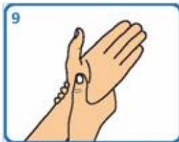
Fregar cada pulso coa man oposta