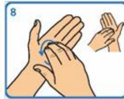
Fregar as xemas dos dedos sobre a palma da man contraria cun movemento circular