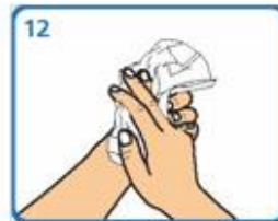
Secar cunha toalla de papel desbotable