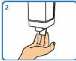
Aplicar suficiente xabón