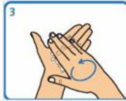
Fregar palma sobre palma