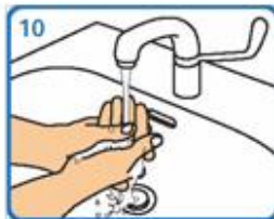
Aclarar con auga